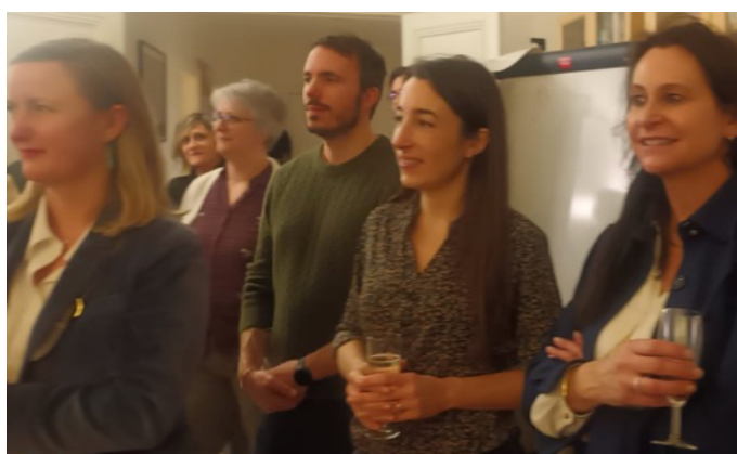
et quelques élèves...